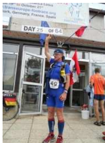
Arrivée à Saint Seine le 12 septembre 2012.

Nous avons eu le plaisir d'accueillir l'arrivée de la 25ème étape de cette course hors normes.