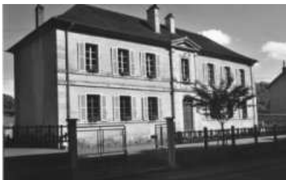
La Tribune du Conseil...

Bulletin semestriel d'information de la commune de Saint-Seine-sur-